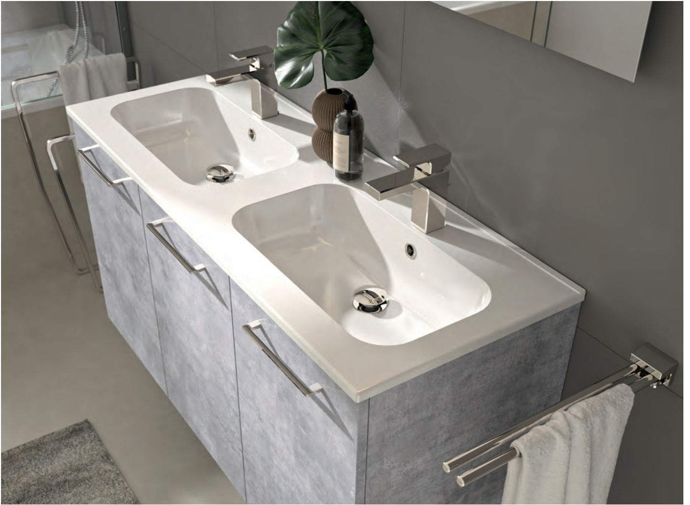
plan vasque en marbre reconstitué brillant PRPLAN