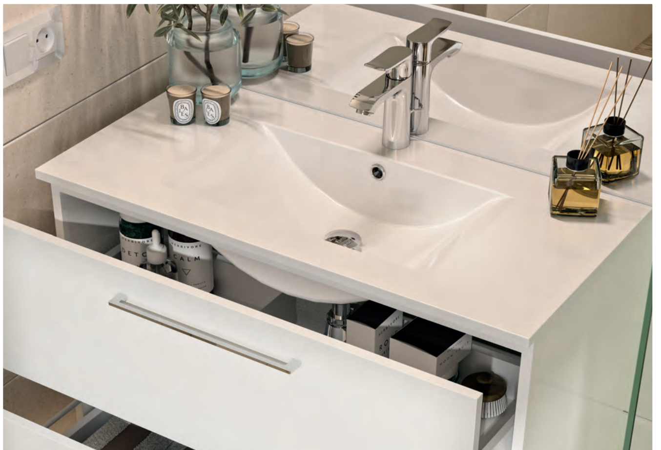
plan vasque en céramique MBPLAN