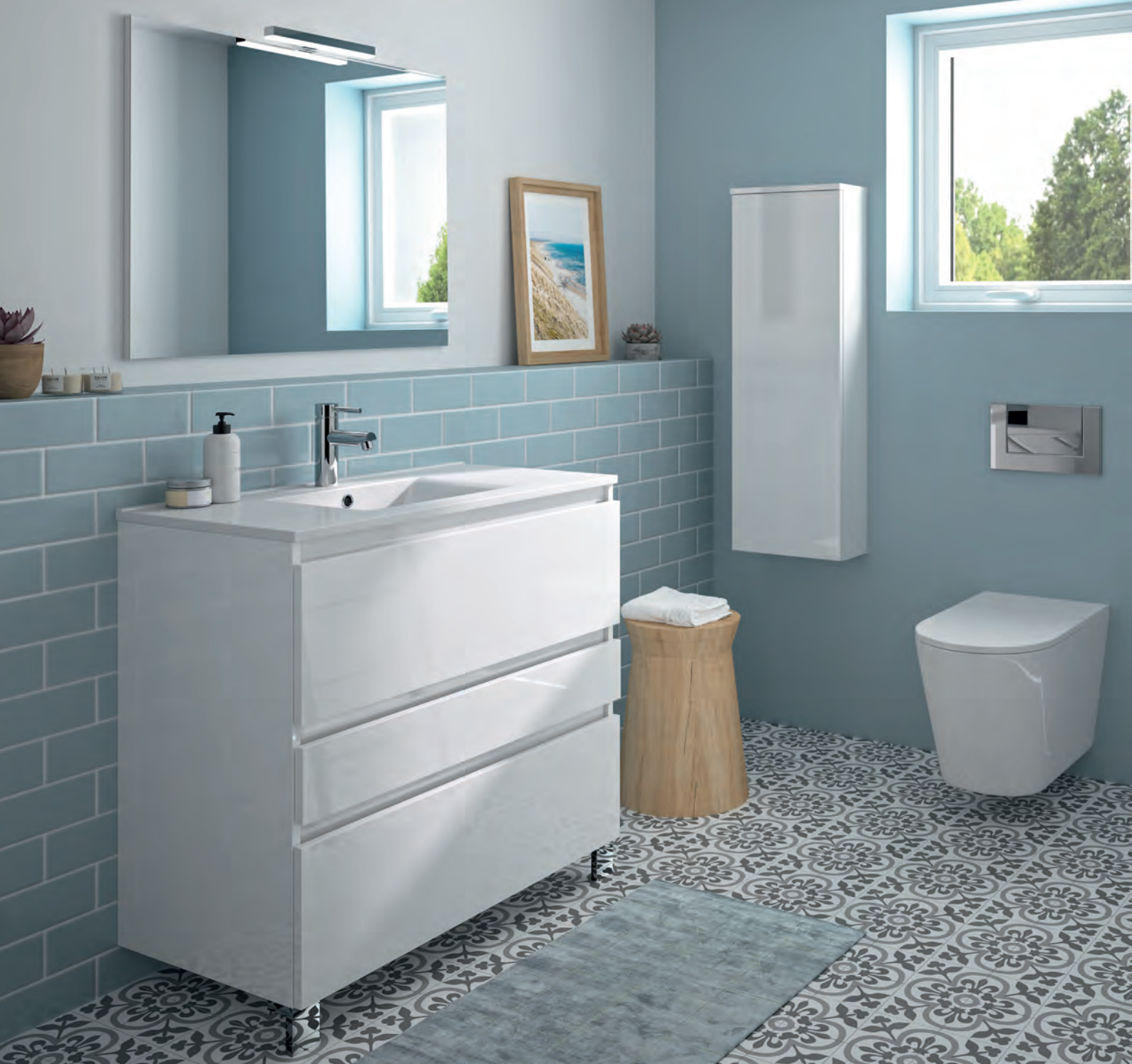
plan vasque en céramique MBPLAN